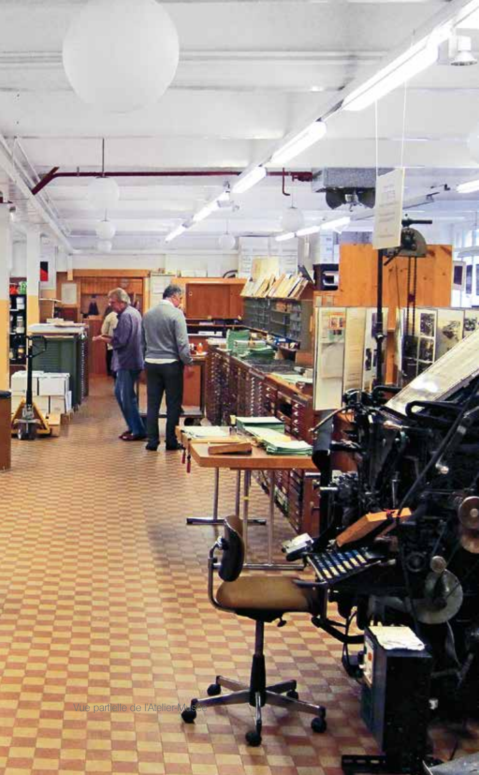
Vue partielle de l'Atelier-Musée