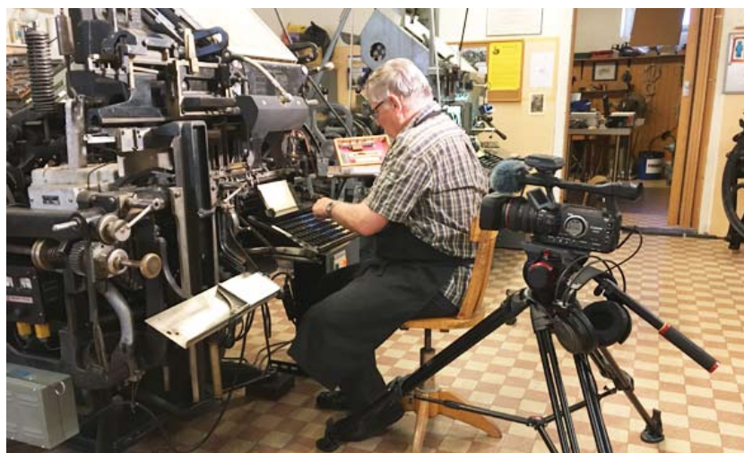
René Wenger en action

En 2005, Linotype Library GmbH raccourcit son nom en Linotype GmbH, et fut finalement acquise par les propriétaires de Monotype Imaging, Inc. en 2007.