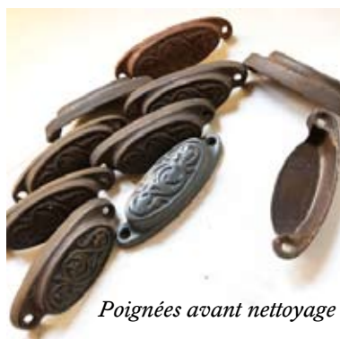
Poignées avant nettoyage