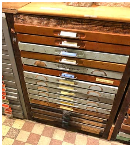
Meuble avant ponçage