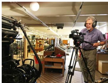
Le caméraman se concentre