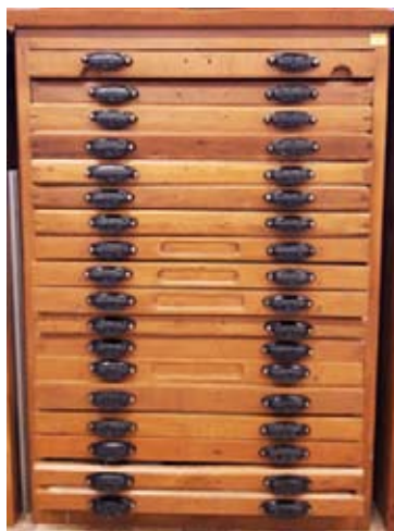
Meuble après rénovation